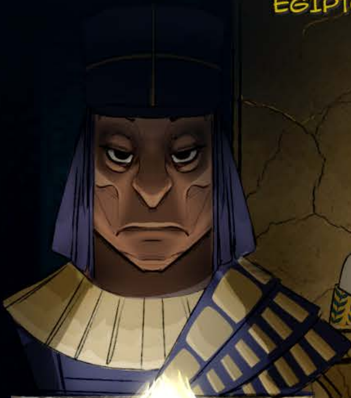
RAMFIS, SUMO SACERDOTE