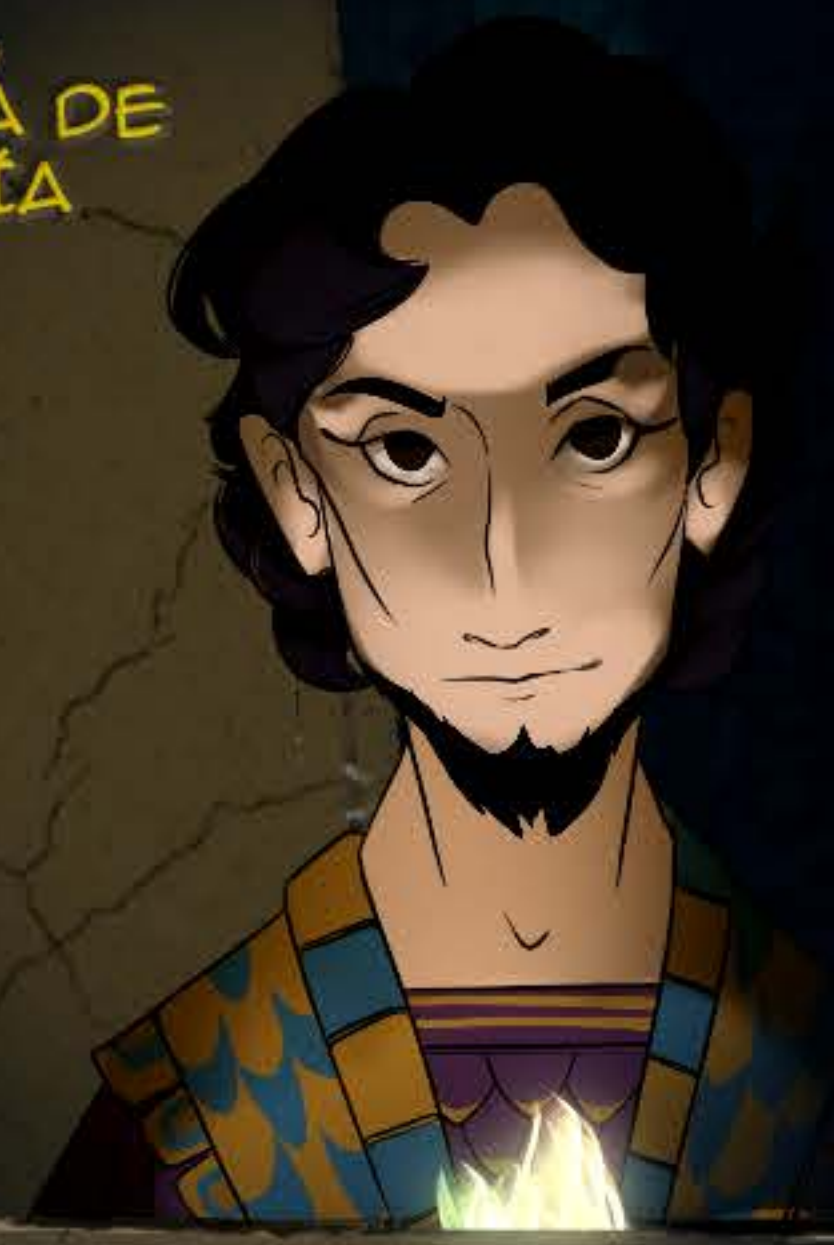
RADAMÈS, COMANDANTE EGIPCIO