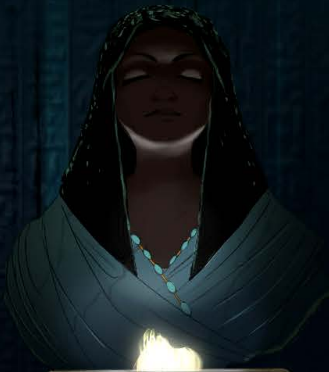
AIDA, PRINCESA DE ETIOPÍA