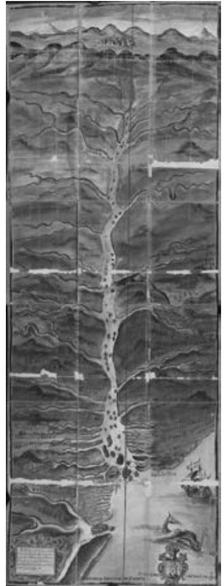
Benito de Acosta, Mapa del río Amazonas y su cuenca, 1638, publicado en el Descubrimiento del río de las Amazonas y sus dilatadas provincias de Martín de Saavedra , 1639

ESTÉTICA Las preguntas clave son: ¿Cuáles son las respuestas emocionales previstas ante el juego? ¿Cómo afecta la combinación de colores la experiencia del jugador? ¿Es el tablero de juego creativo e imaginativo, transportando a los jugadores a un mundo y/o a una época diferentes?