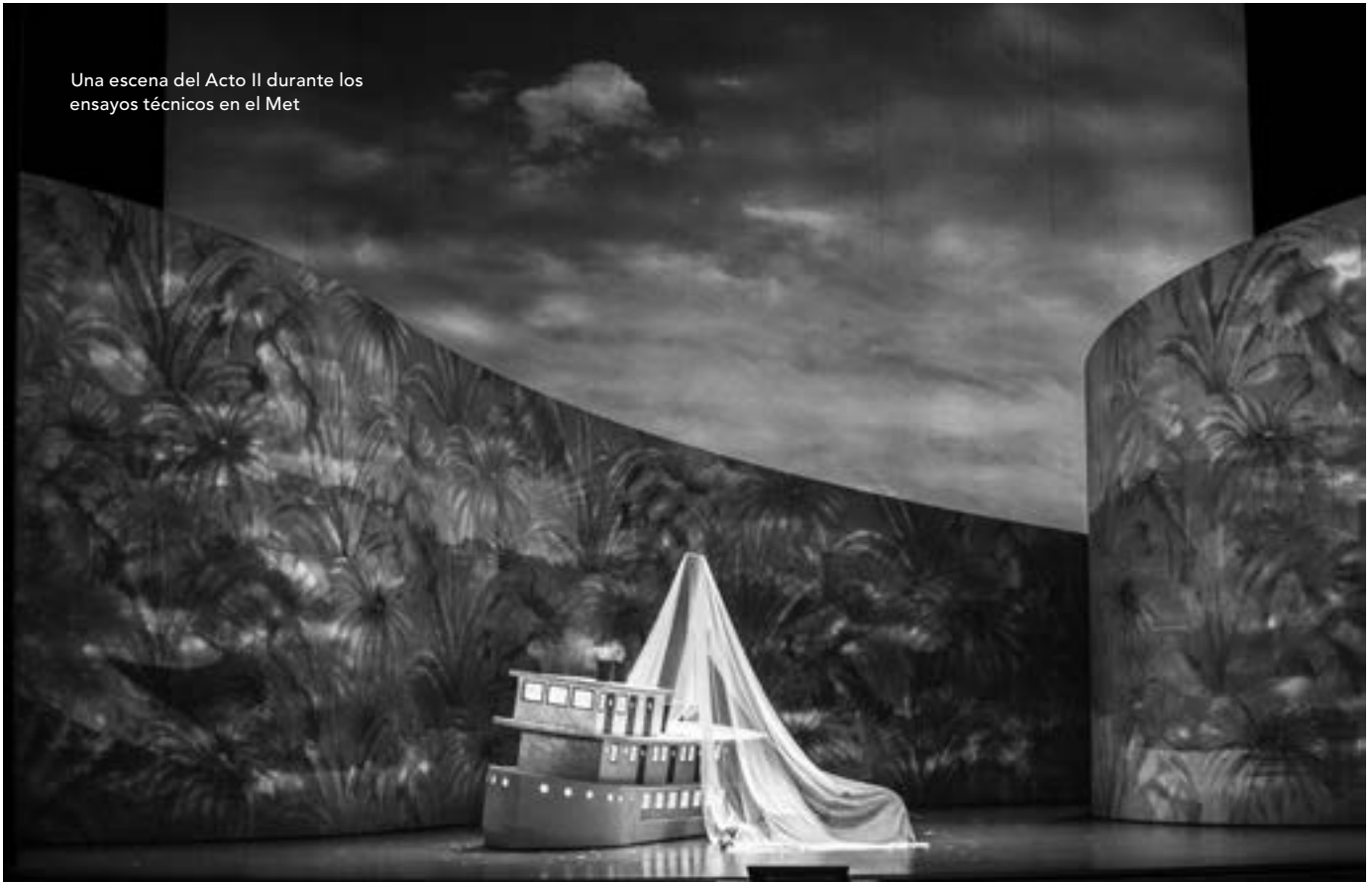
Una escena del Acto II durante los ensayos técnicos en el Met

El Dorado emprende de nuevo el viaje. Aparece Riolobo, que da las gracias a los espíritus del río por no haber destruido el barco. El capitán regresa, impresionado por lo bien que Arcadio ha manejado el barco durante la tormenta. Arcadio se siente enfermo y lo atribuye al mareo, pero el capitán cree que tan solo está enfermo de amor y le da un amuleto. Rosalba, Florencia y Paula reaparecen. Justo cuando Paula se prepara para avisar que Alvaro ha desaparecido, éste reaparece para sorpresa de todos. Les cuenta que murió en la tormenta pero que fue resucitado por la voz de Paula, lo cual es confirmado