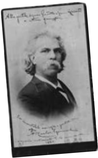
El compositor brasileño Antônio Carlos Gomes

La ópera italiana predominó en Latinoamérica en los siglos XVIII y XIX. Para muchas élites y espectadores que vivían en los territorios españoles del Nuevo Mundo, la promoción del estilo italiano era una manera tanto de emular la alta cultura europea como de rechazar la influencia española. Las obras de Gioachino Rossini—compositor de Il Barbiere di Siviglia (1816), La Cenerentola (1817) y Armida (1817), entre muchas otras—fueron especialmente populares. En México, la ópera italiana fue promovida por el tenor y empresario español Manuel García, y algunos compositores latinoamericanos incluso produjeron óperas italianas que fueron bien recibidas en Europa, entre ellos el brasileño Antônio Carlos Gomes (1836–1896). Sus óperas Il Guarany (1870), Fosca (1873, rev. 1878), Maria Tudor (1879) y Condor (1891) se estrenaron en el Teatro alla Scala de Milán.