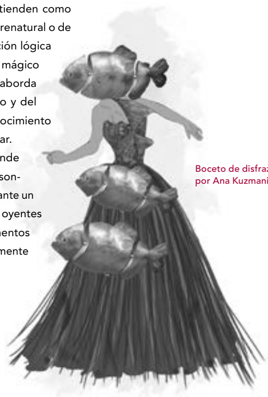
Boceto de disfraz de piraña por Ana Kuzmanić

Uno de los personajes principales de Florencia en el Amazonas es la figura mística cambiaforma Riolobo, cuyo nombre significa literalmente “lobo de río”. Riolobo desempeña muchas funciones a bordo de El Dorado, desde servir la cena hasta calmar la tormenta que obliga al barco de vapor a encallar. ¿Qué opinas de este personaje y de su función en la ópera? ¿Es Riolobo un dios, un espíritu u otra cosa? ¿Cuál es su importancia dramática?