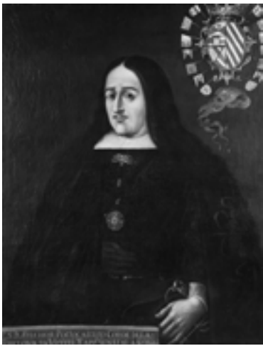
El Virrey Melchor Portocarrero Lasso de la Vega encargó La púrpura de la rosa MUSEO NACIONAL DE HISTORIA, CIUDAD DE MÉXICO

Aunque Florencia en el Amazonas es la primera ópera de un compositor latinoamericano que se pone en escena en el Met—y la primera obra en español en casi cien años—la ópera como género se produce y representa en América Latina desde hace más de tres siglos. La primera ópera conocida que se estrenó en Latinoamérica fue una obra del compositor español Tomás de Torrejón y Velasco (1644–1728) titulada La púrpura de la Rosa , estrenada el 19 de octubre de 1701 en Lima, Perú en conmemoración del decimoctavo cumpleaños del rey Felipe V de España. De este modo, la ópera llegó a Latinoamérica varias décadas antes de que apareciera en lo que hoy es Estados Unidos, cuando se representó Flora , una ópera de baladas, en Charleston, Carolina del Sur, en 1735. El libreto de la ópera fue escrito por el dramaturgo y poeta español Pedro Calderón de la Barca, quien adaptó el trabajo que había realizado para una ópera del compositor Juan Hidalgo estrenada en Madrid hacia 1660.