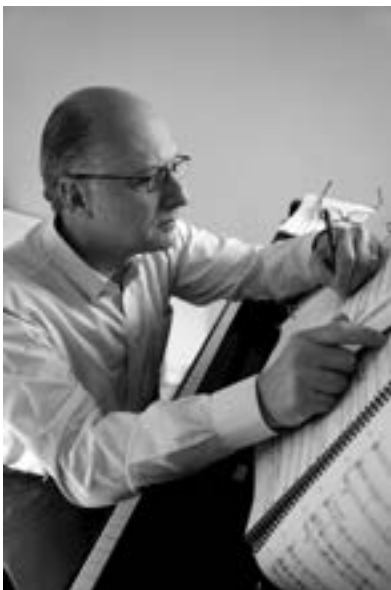
El compositor Daniel Catán

Cuando los alumnos reciban el trabajo que se les ha pasado, deben esforzarse por ampliar la creación de sus compañeros añadiéndole otro elemento. Por ejemplo, si un dibujante recibe una hoja de un escritor, debe permitir que las palabras o frases inspiren su dibujo. Transcurridos 30 segundos, todos los integrantes del círculo volverán a pasarse el papel en sentido contrario a las agujas del reloj. Continúe este proceso hasta completar la selección musical. Comparta cada producto acabado con el grupo, tomando nota de los elementos comunes y las diferencias entre cada soporte visual colectivo. Plantee las siguientes preguntas: